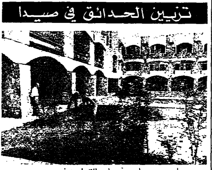
صيدا - من مراسل « الانوار » : بدأت امس عمال الحدائق في بلدية صيدا تزيين الحدائق الحكومية العامة والحدائق البلدية . في الصورة العمال يزرعون الورود حديقة سراي صيدا .

صيدا - من مراسل « الانوار » : بدأ امس عمال الحدائق في بلدية صيدا تزيين الحدائق الحكومية العامة والحدائق البلدية . في الصورة العمال يزرعون الورود حديقة سراي صيدا .